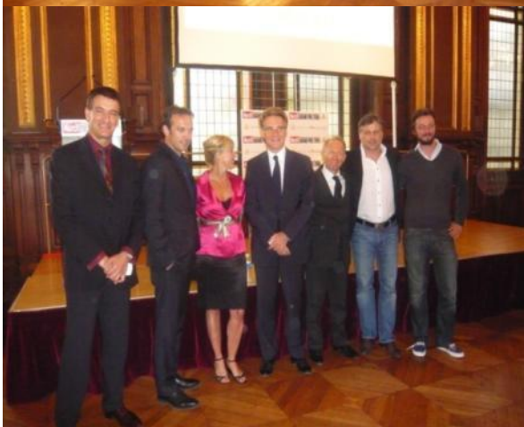
Le jury du grand prix 2008 : Vincent Perez - parrain de la 5 ème édition