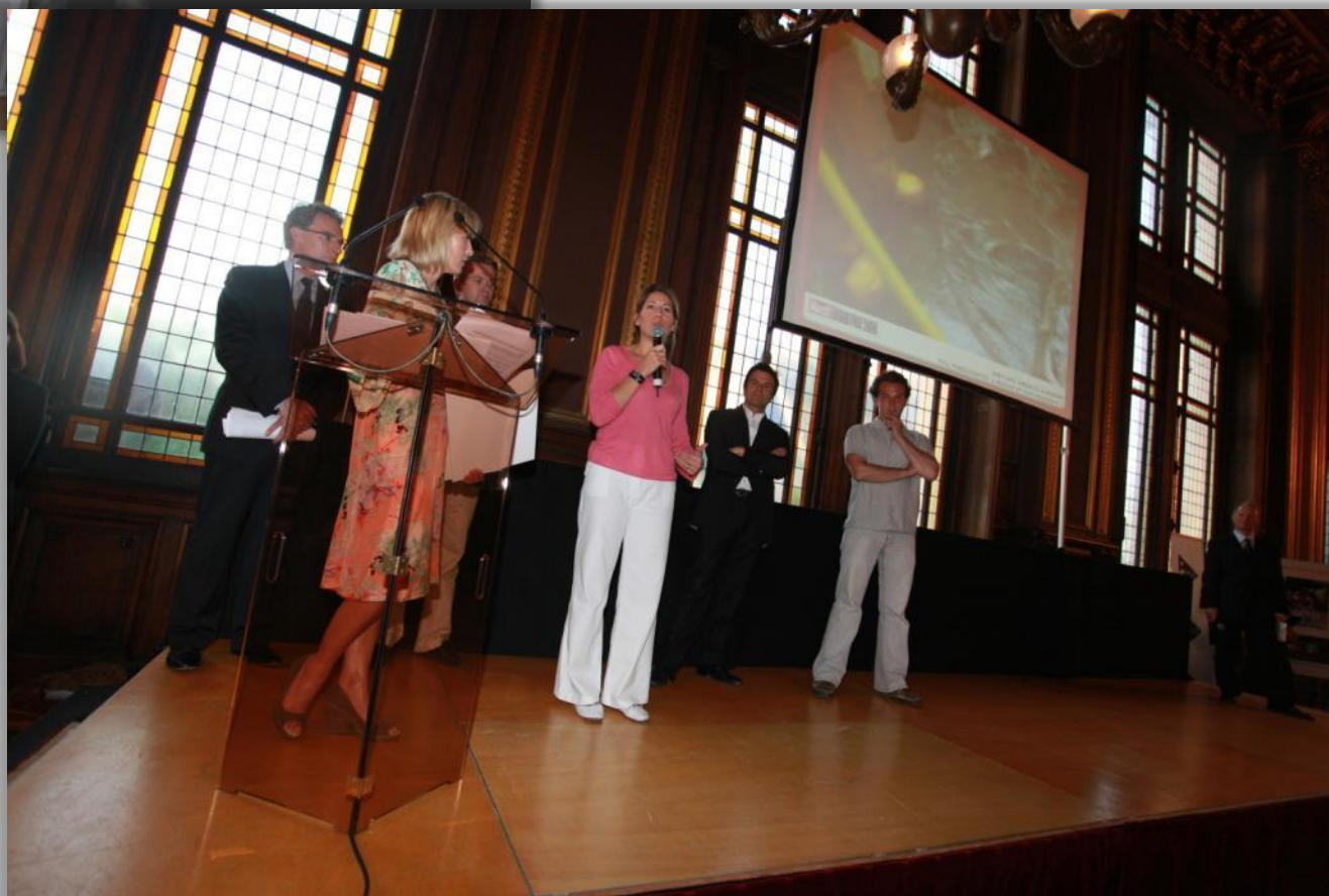
Le jury du Grand Prix 2009 , présidé par Maud Fontenoy , marraine de la 6 ème édition